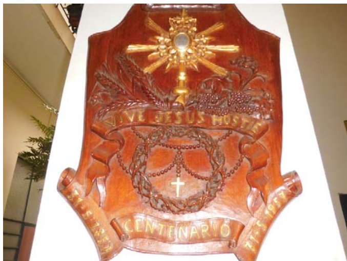
Escudo de la Congregación Siervas de Jesús en Casa Madre. Caracas, Venezuela.

No me elegisteis vosotros a mí, sino que yo os elegí a vosotros, y os he puesto para que vayáis y llevéis fruto, y vuestro fruto permanezca; para que todo lo que pidieréis al Padre en mi nombre, él os lo dé. Juan 15:16