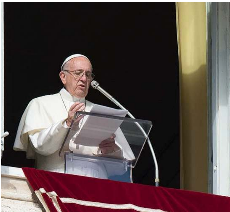
El Papa Francisco en el rezo del Angelus.