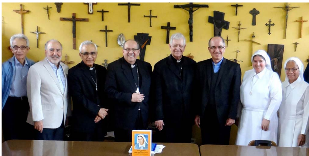
Reunión de la Comisión Organizadora de la Beatificación de Madre Carmen Rendiles