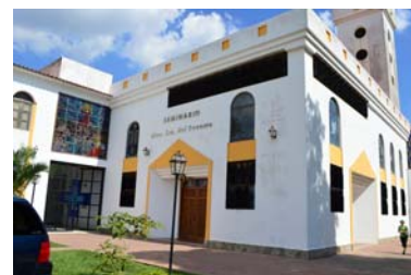
Fachada del Seminario Nuestra Señora del Socorro, en el Estado Carabobo, Venezuela.