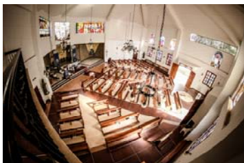
Capilla del Seminario Nuestra Señora del Socorro