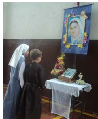
Los alumnos del Colegio Madre Carmen en una obra de teatro sobre la vida de nuestra fundadora