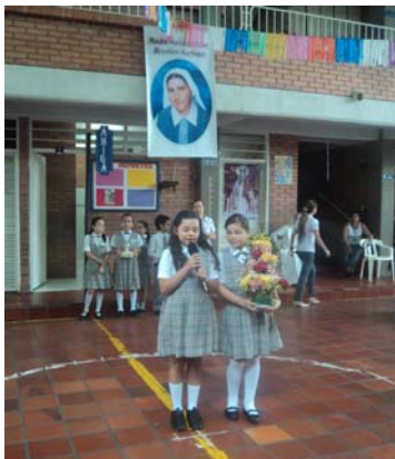
Alumnos del Colegio Madre Carmen en exposiciones relacionadas con la vida de Madre Carmen.