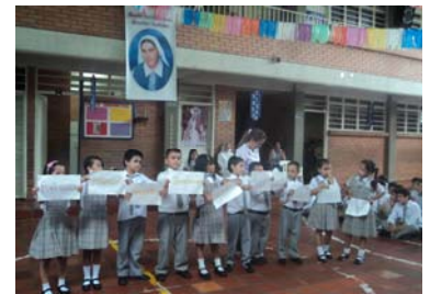
Alumnos del Colegio Madre Carmen en un homenaje a nuestra fundadora.

Sin dejar de colaborar con la parroquia más cercana en la actualidad funcionan los tres primeros niveles