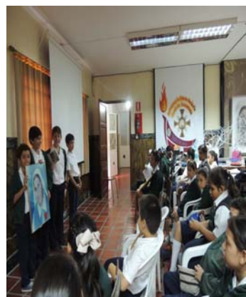
Los alumnos del Colegio Belén en el curso de religión para la Primera Comunión hablan de Madre Carmen

Con nuestros alumnos realizamos diferentes obras sociales, en