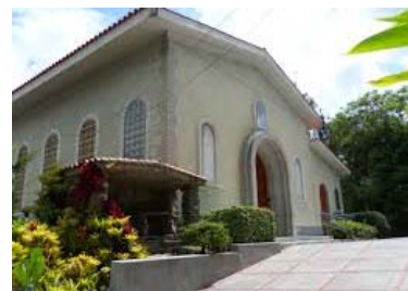
La Capilla del Colegio Belén de Los Palos Grandes en la actualidad, lugar donde reposan los restos de nuestra fundadora.

Las superiores de la Comunidad a partir de 1980 han sido las hermanas: