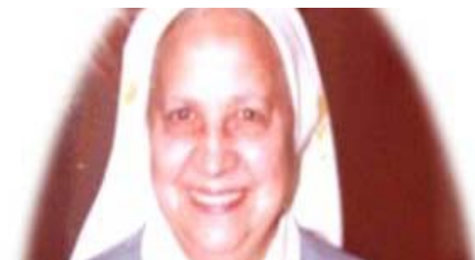
Madre San José Reyes

Durante este período de Gobierno se hicieron cargo las hermanas del Seminario San José del Hatillo, el Seminario de Mérida, se