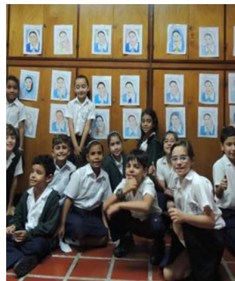
Los alumnos del Colegio Belén en una exposición de dibujos de Madre Carmen