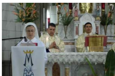
Homilía en la Capilla de Casa Madre