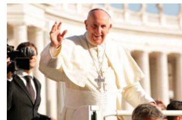
El Papa en la Audiencia General

"En la hora de la cruz, la salvación de Cristo alcanza su culmen, y su promesa al buen ladrón revela el cumplimiento de su misión: salvar a los pecadores", concluyó el Papa.