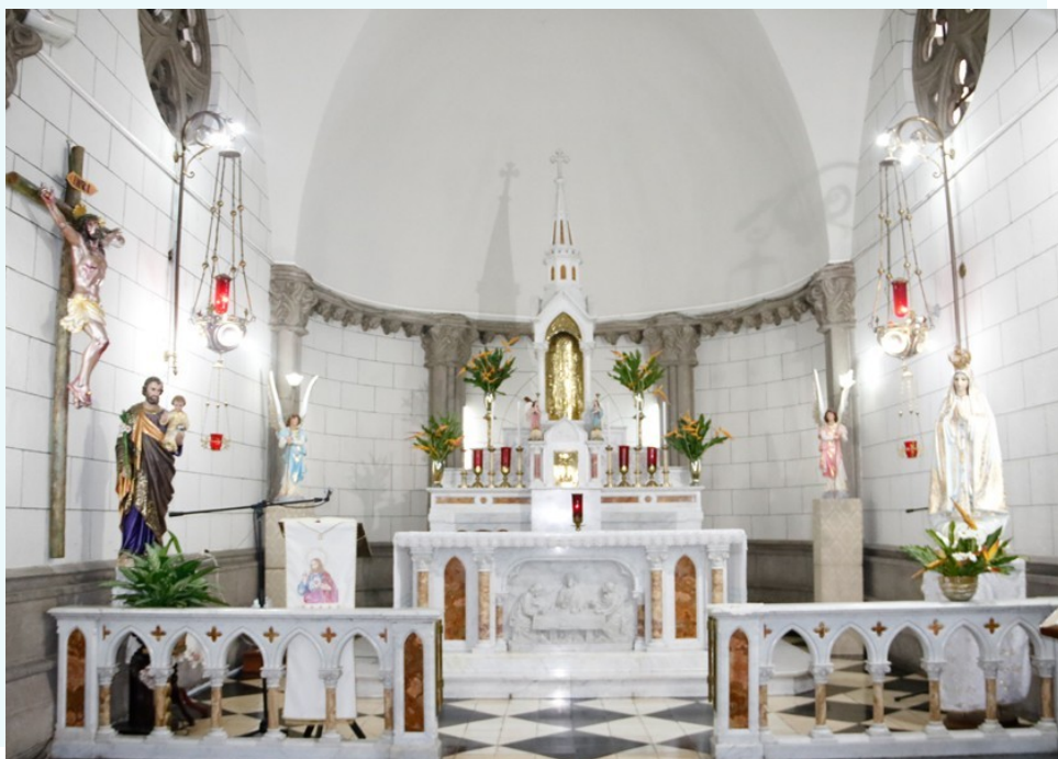
Capilla de Casa Madre